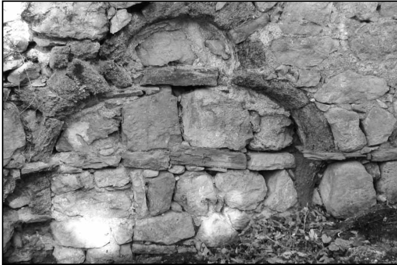
Рис.1. Антропоморфная ниша в интерьере выявленного христианского храма. Местность «Галгай-наарге». Горная Ингушетия.

В интерьере наблюдаются фрагменты гладкой бело-желтой штукатурки. В северной стене фиксируются остатки двух антропоморфных ниш-углублений. Последнее – доселе неизвестный прием оформления интерьера христианских храмов горной Ингушетии. По-видимому, аналогов подобным элементам нет и на памятниках христианства Северного Кавказа. Со всей осторожностью можно предположить, что в рассматриваемых нишах могли заключаться фрески с изображениями христианских святых. Предварительная датировка храма – XIII век.